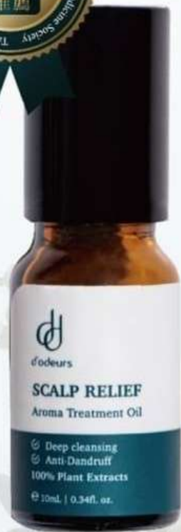
頭皮喚醒按摩滾珠 10mL NTS680