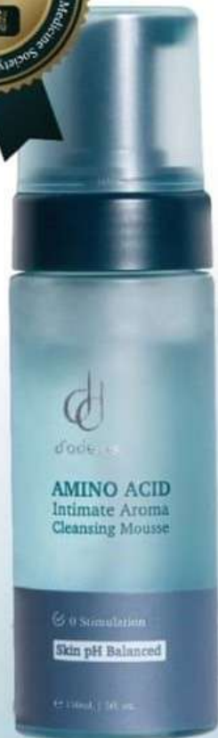
氨基酸私密慕斯 150mL NTS880