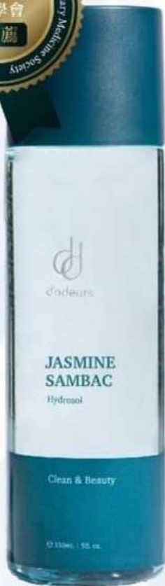
茉莉精露 150mL NT$580