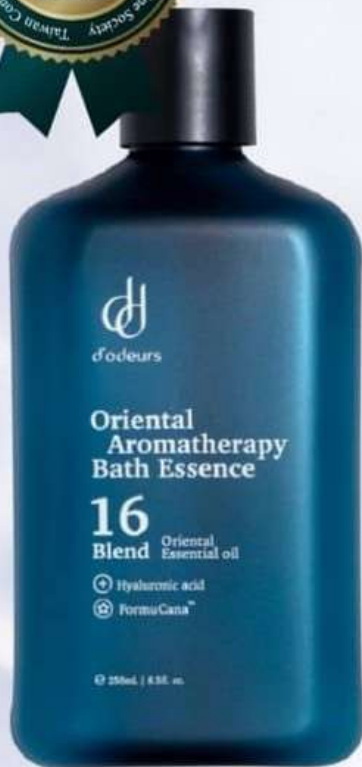
節氣湯浴16味 250mL NT$980