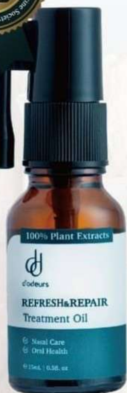
清涼修護精華油 15mL NTS680