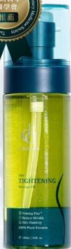
極效美體全能油 100mL NT$980