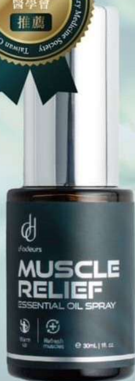
酸凍冰涼油 30mL NT.680