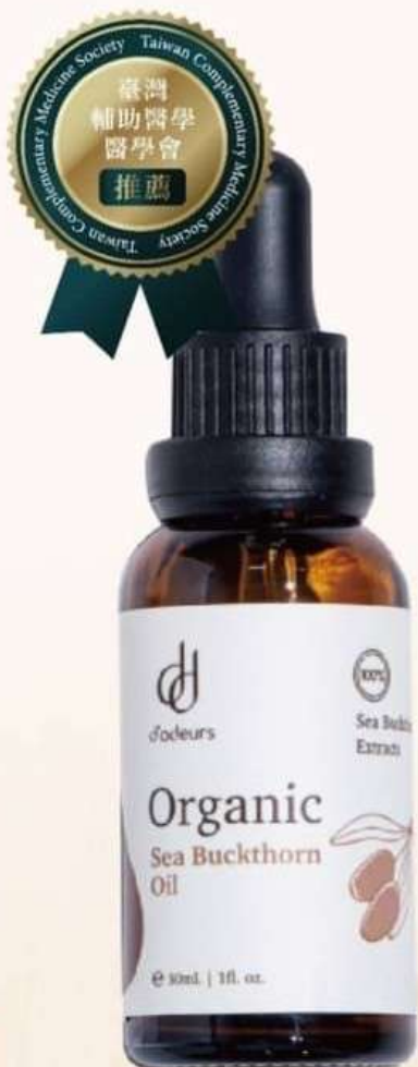
極地野生小果沙棘油 30mL NTS1,380

Golden Ratio Omega 3, 6, 7,9 & Vitamins Support Overall Health