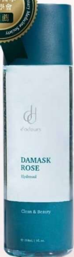
玫瑰精露 150mL NT$580